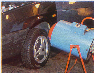
После обязательной мойки автомобиля сушат тепловыми пушками

Пожалуй, самый «лакомый кусочек» для экономных специали-